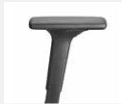
A441KGS (4F) Armauflagen PU soft Armpads PU soft