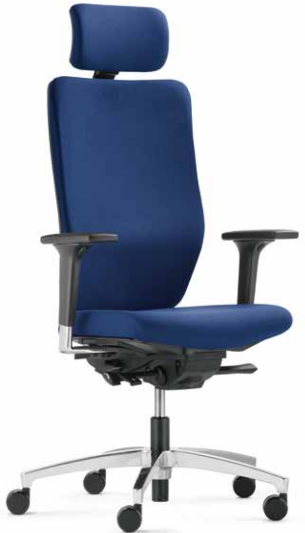
QS ST 6895 operator + Armlehnen | Armrests A341APO