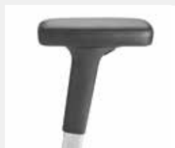
A442APO (4F) Leder-Armauflagen Leather armpads