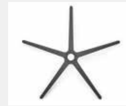
FHKGS Kunststoff schwarz (Standard) Black plastic (standard)