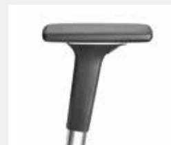
A541APO (5F) Armauflagen PU soft Armpads PU soft