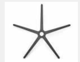
FHKGS Kunststoff schwarz (Standard) Black plastic (standard)