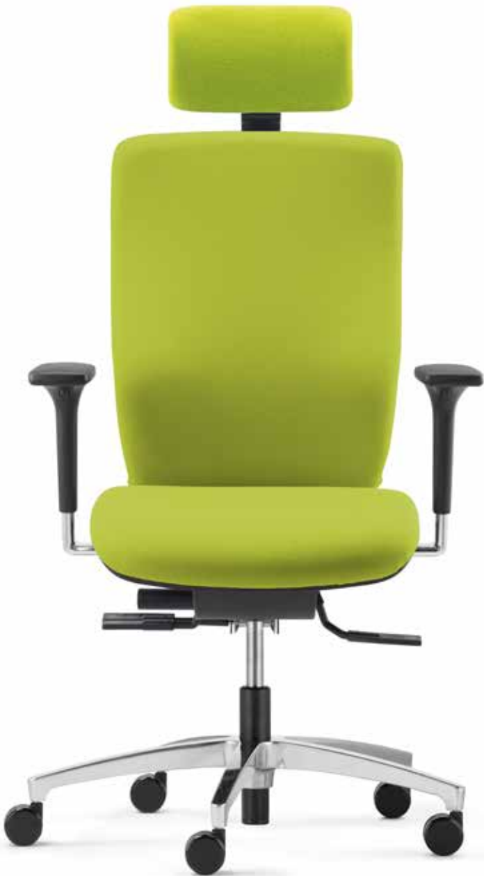
AB ST 6998 comfort + Armlehnen | Armrests A341APO