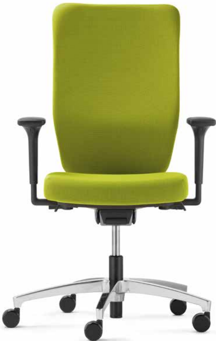
TA ST 6854 operator + Armlehnen | Armrests A241KGS