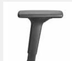
A441KGS (4F) Armauflagen PU soft Armpads PU soft