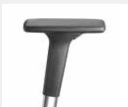
A341APO / A441APO (3F/4F) Armauflagen PU soft Armpads PU soft