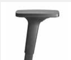
A240KGS (2F) Armauflagen PU Armpads PU