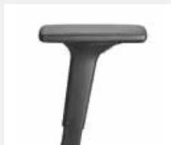
A241KGS (2F) Armauflagen PU soft Armpads PU soft