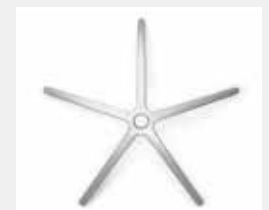
FHAP0 Aluminium poliert (Option) Aluminium polished (option)