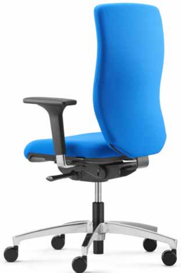
QS ST 6955 comfort + Armlehnen | Armrests A341APO